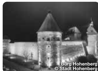
Burg Hohenberg

Das Informationszentrum „ROGG IN“ in Weißenstadt ist einzigartig in Deutschland und bietet neben vielen Informationen zu Anbau, Verarbeitung und Bedeutung des Roggens dem Besucher auch sinnliche Erlebnisse. Goethestraße 25, Bad Weißenstadt