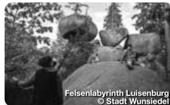
Felsenlabyrinth Luisenburg

„Ich bin gern in dir geboren, kleine aber gute, lichte Stadt“, so beschreibt der bekannte Wunsiedler Dichter Jean Paul seine Geburtsstadt! TreffpunktDeutschland.de/wunsiedel