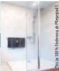
bis zu 100% Förderung ab Pflegegrad 1

Mehrfach ausgezeichnetes Handwerk | REGIONAL · ZUVERLÄSSIG · ERFAHREN