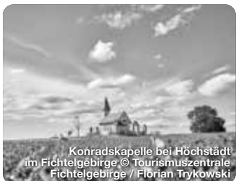
Konradskapelle bei Höchstädt im Fichtelgebirge

Der Landkreis Wunsiedel i. Fichtelgebirge liegt inmitten des Naturparks Fichtelgebirge und bietet mit seiner vielfältigen Landschaft zu jeder Jahreszeit eine immense Fülle an Erlebnissen – für Aktivurlauber, Genießer sowie Familien, aber auch für die nächsten Touren im Wohnmobil oder den anstehenden Wellnessstrip. Dem Aktivurlaub im Fichtelgebirge kommt eine besondere Bedeutung zu: Ob Wandern, Radfahren oder Wintersport, das Fichtelgebirge lässt sich am besten bei Ausflügen in der freien Natur erleben. Thermen, Bewegung in der Natur, Kneipp-Therapien und Tretbecken versprechen Erholung und Entspannung in unberührter Natur im Naturpark Fichtelgebirge. TreffpunktDeutschland.de/wunsiedel-region