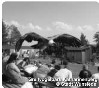
Greifvogelpark Katharinenberg

Röslau liegt landschaftlich schön am bayerischen Oberlauf der Eger in einer Höhe von 555 bis 602 Metern. Der Mittelpunkt des Fichtelgebirges. TreffpunktDeutschland.de/roeslau