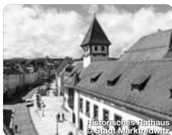
Historisches Rathaus

Hohenberg ist eine kleine Stadt mit großen Geschichten. Neben dem imposanten Wahrzeichen „Burg Hohenberg“ gibt es noch viele weitere interessante Highlights in der Stadt zu entdecken. TreffpunktDeutschland.de/hohenberg