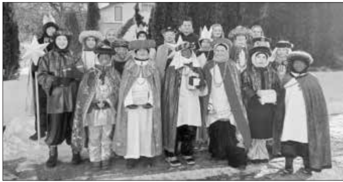
Pfarrei „St. Laurentius u. Agatha“ Frankenhofen Sternsingergruppe Frankenhofen