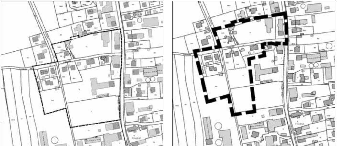
Abbildung 1: Lageplan des Geltungsbereichs des gegenständlichen Bebauungsplanes (links) und der gegenständlichen Flächennutzungsplanänderung (rechts), unmaßstäblich

Im Einzelnen gelten die Lagepläne vom 19.08.2025. Sie sind im folgenden Kartenausschnitt dargestellt: