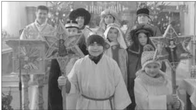
Pfarrei „St. Stephan u. Oswald“, Osterzell Sternsingergruppe Osterzell