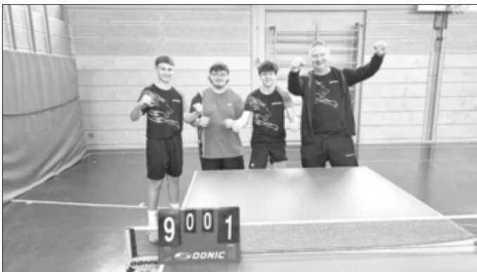
Herbstmeister: die Jugendmannschaft der SG Dösingen mit Trainer.

Die Tischtennis-Vorrunde ist beendet – und die SG Dösingen kann in mehreren Ligen auf eine äußerst erfolgreiche Spielzeit zurückblicken.