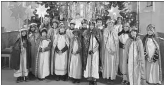
Pfarrei „St. Gordian u. Epimach“ Stöttwang Sternsingergruppe Stöttwang