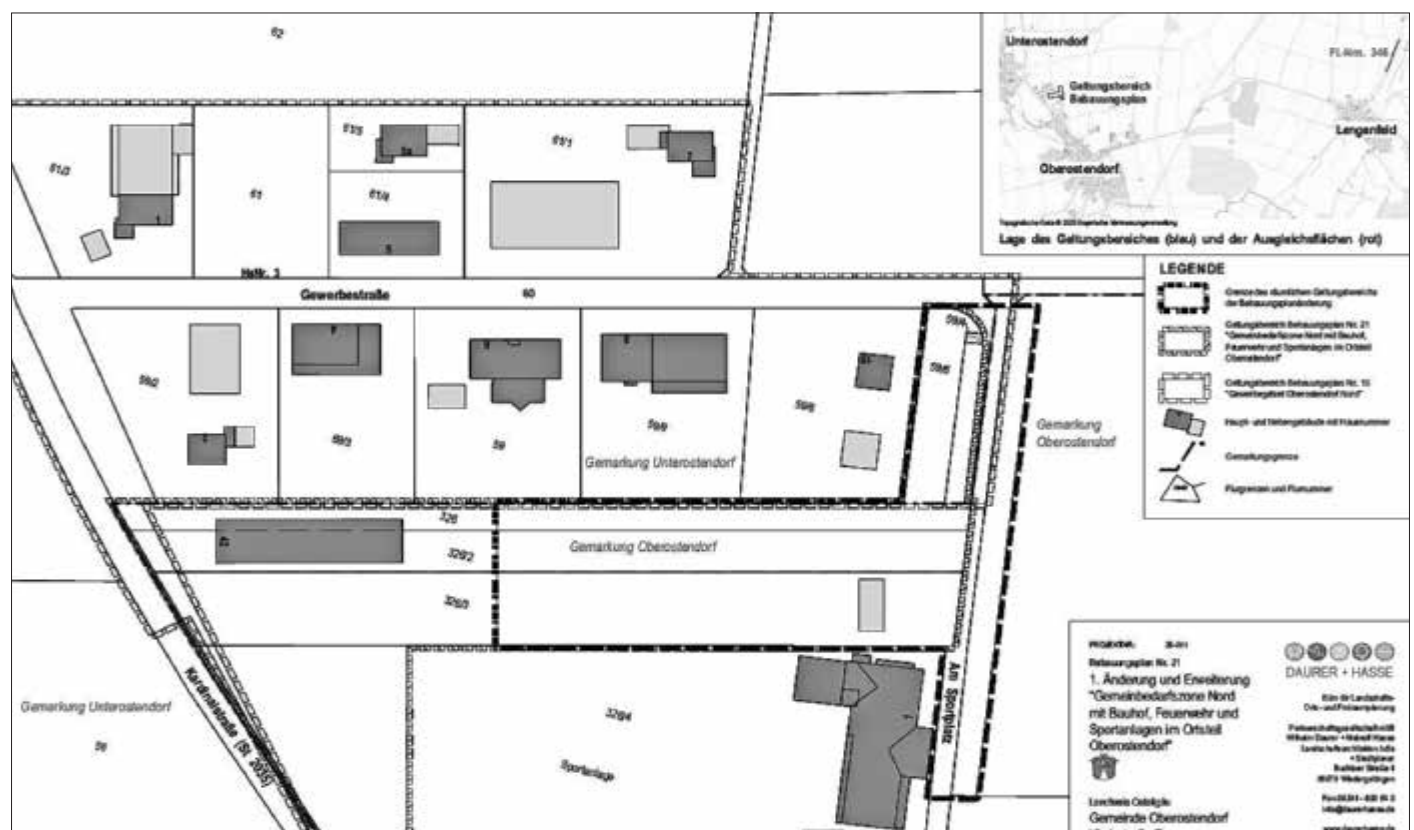
Lageplan Bebauungsplan mit Geltungsbereich, © Bayerische Vermessungsverwaltung 2020 / 2025